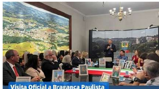
Visita Oficial a Bragança Paulista