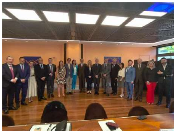
L'Ambasciatore, il Vice direttore, i 7 Consoli, i 4 CGIE, 5 Com.ItEs

La presidente del ComItEs RS è stata per tutta la durata on-line e la presidente del ComItEs di Recife, per problemi privati, non ha potuto partecipare, mentre la vicepresidente del ComItEs di MG lo ha rappresentato.